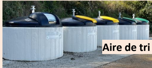
Aire de tri

Ecole Mobiliers Installation climatiseur Vidéo projecteur et matériel informatique